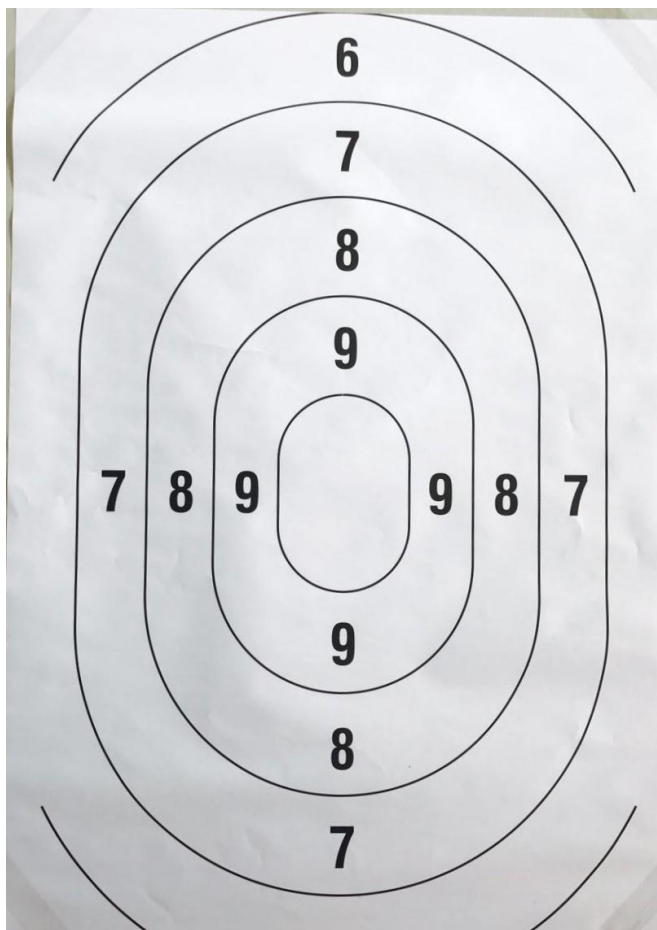
Figura 1. Dimensiones aproximadas 70 cm de largo, 49 cm de ancho.

El tipo de blancos a ser utilizado será el siguiente: