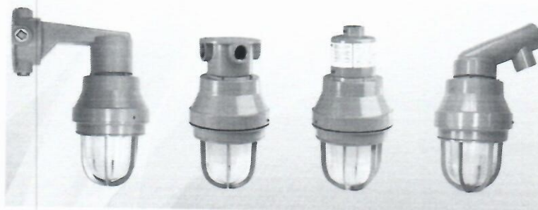
2. Lámparas "explosión proof"